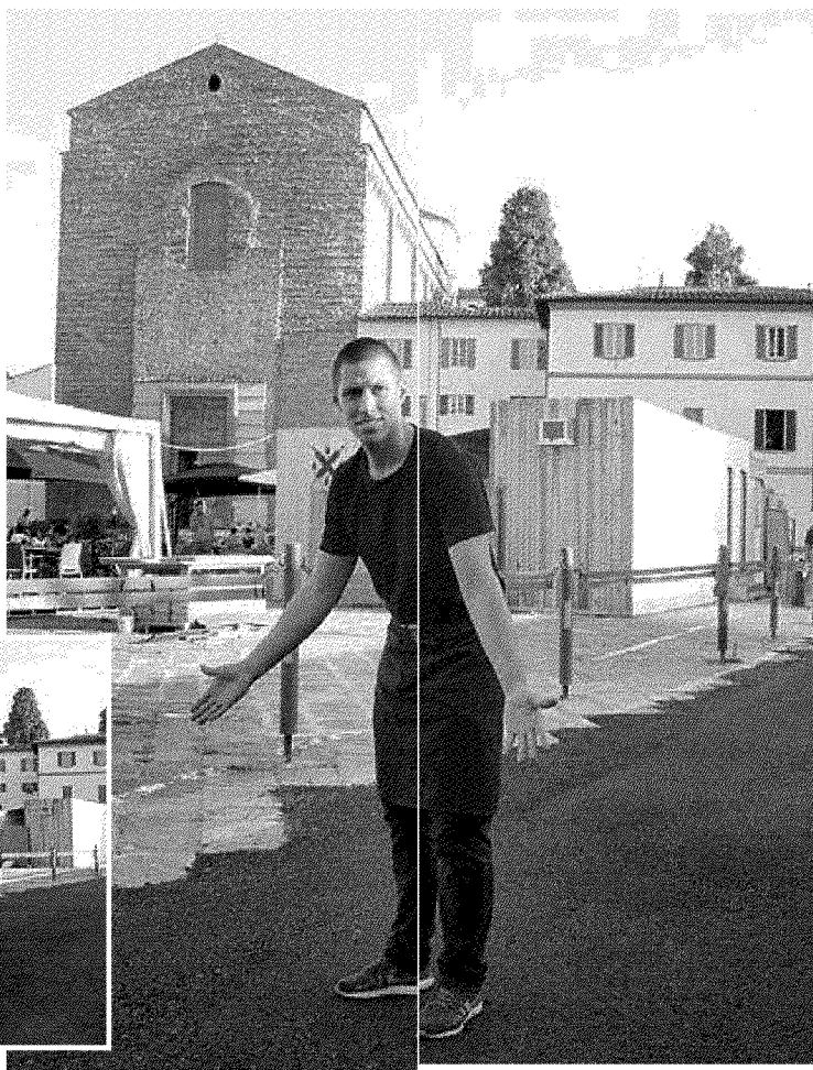
Le toppe d'asfalto "provvisorie" in piazza del Carmine non piacciono ai residenti