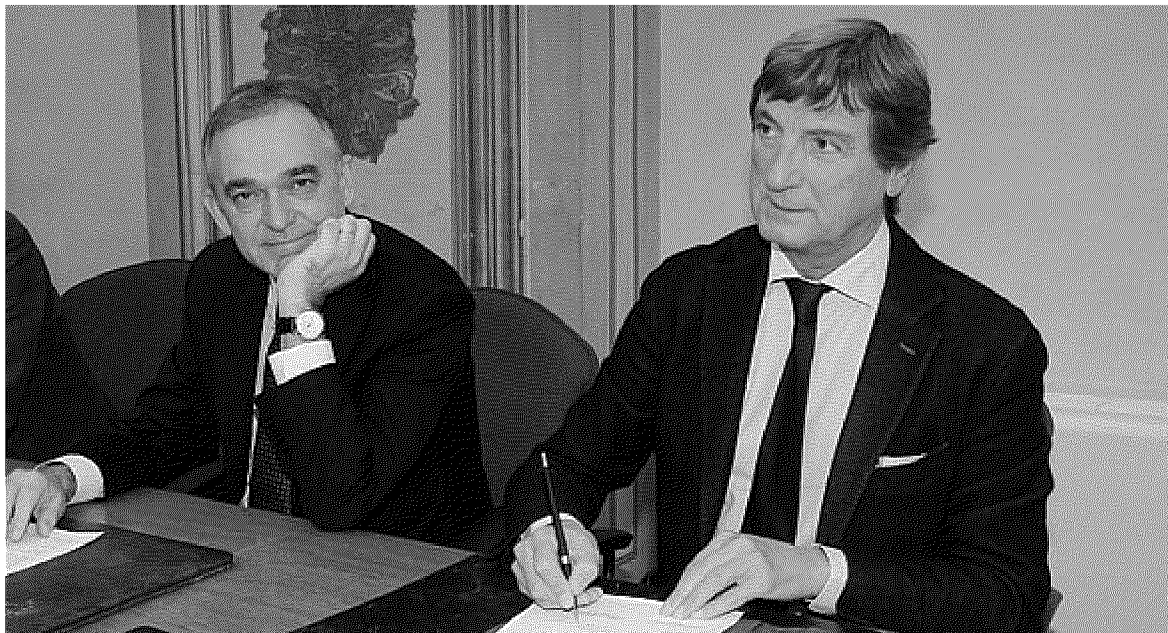
ISTITUZIONI Il governatore Enrico Rossi e il sindaco Angelo Zubbani soddisfatti per l'impegno del Governo