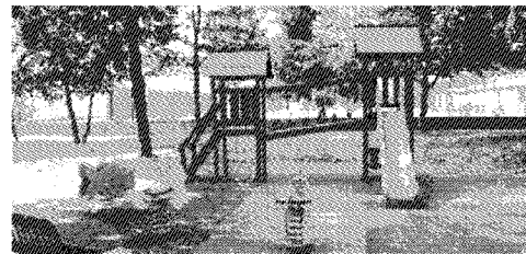
IL PIANO CITTÀ (2012)

I Comuni hanno presentato i progetti entro il 30 novembre 2015. La formazione della graduatoria dei progetti da finanziare è ancora in corso