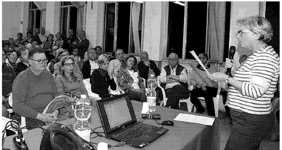
L'assemblea organizzata dal Comitato cittadino che si batte per la realizzazione della linea sopraelevata

Comune e Comitato cittadino chiedono invece di realizzare una linea sopraelevata che dalla stazione «grande» di piazza Italia copra l'intero tratto cittadino