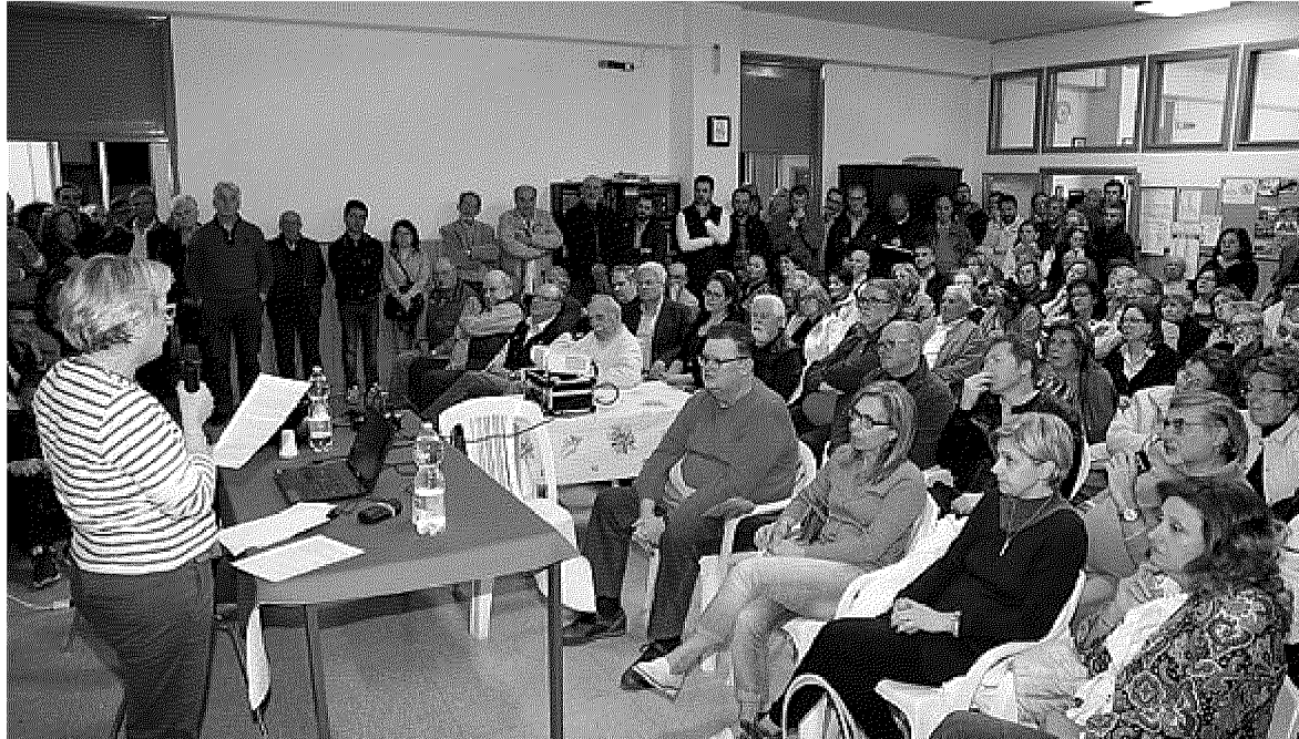
La recente riunione del comitato «Montecatiniunasola» sul raddoppio della ferrovia