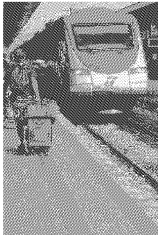
Le Ferrovie in espansione Ansa

Veniamo ora all'estensione ai trasporti urbani del perimetro di azione di Fsi (che gestisce e possiede la rete ferroviaria, e fornisce servizi passeggeri a livello locale e nazionale, e servizi merci, controllando il 90% del mercato: non soffre certo di nanismo, anzi). La teoria economica sconsiglia la "integrazione verticale di impresa dominante": a una impresa che già dispone di un grande potere di mercato, non dovrebbe essere consentito di diventare ancora più potente, piuttosto il contrario (celebri i casi dei telefoni e delle società petrolifere Usa, o degli aeroporti di Londra, costretti allo "spezzatino" dal regolatore pub-