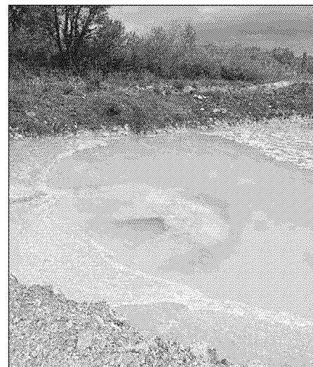
Intervento della Forestale In un impianto della Valtiberina

Gli uomini del Corpo Forestale interventuti in una struttura di produzione del calcestruzzo