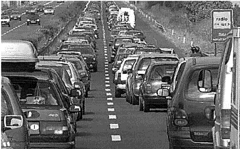
Un tratto dell'autostrada Firenze-Mare nel tratto della Valdinievole durante un esodo durante le vacanze