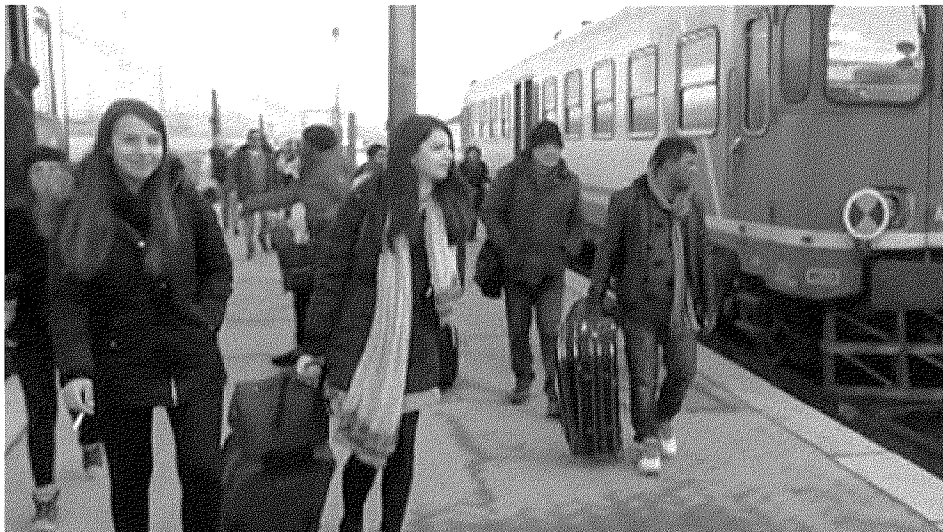
STOP Nel piano strutturale anche due nuove fermate sulla linea ferroviaria: a S.Donato e al Campo di Marte

IL RISULTATO finale dovrebbe essere un alleggerimento complessivo del traffico e delle emissioni in circonvallazione. Anche grazie a nuovi collegamenti come la nuova viabilità di San Marco, tra Campo di Marte e il Carrefour