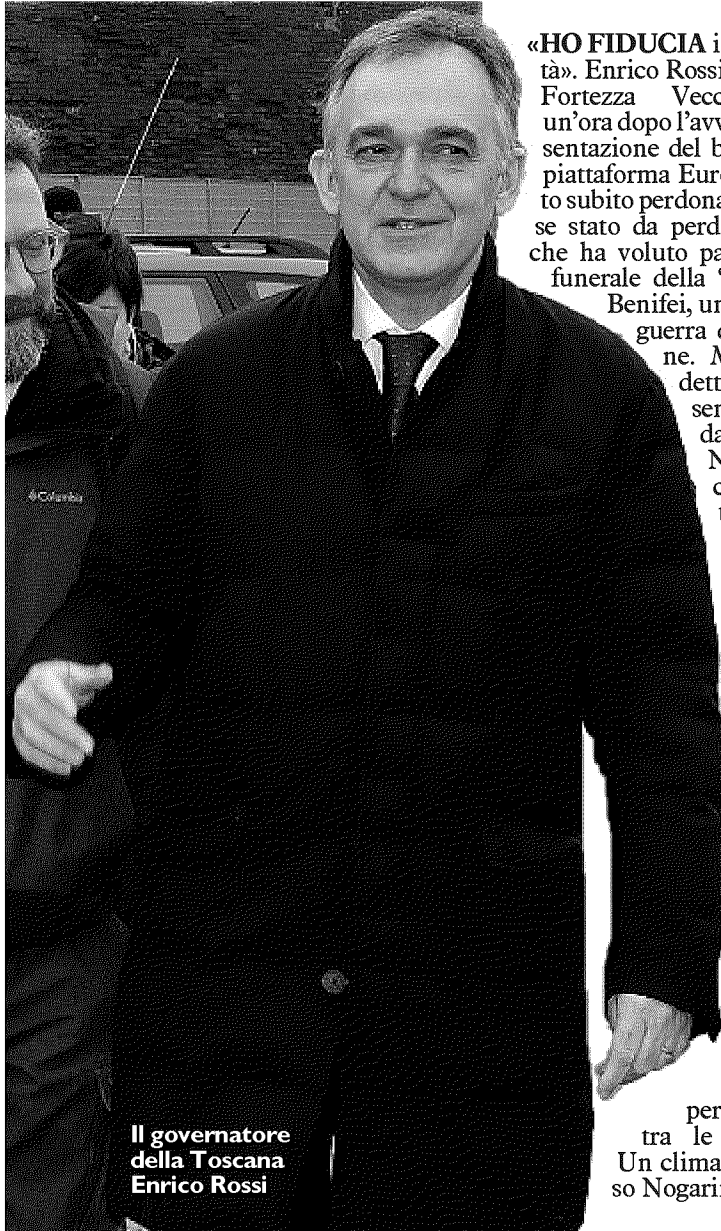
Il governatore della Toscana Enrico Rossi

Piattaforma Europa, la presentazione del bando tra sorrisi e dubbi