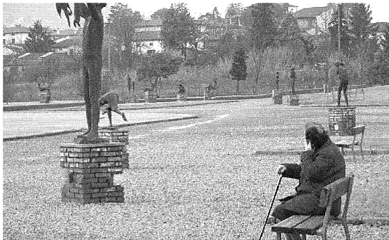
L'AREA Il piano prevede l'acquisizione del terreno del parco Martini