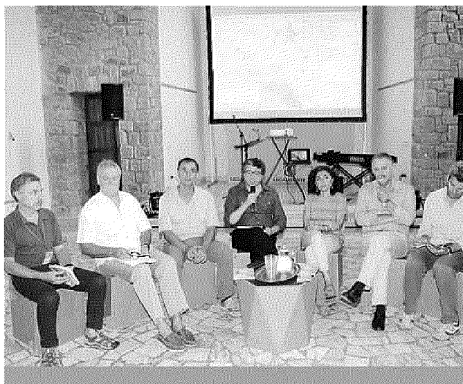
I relatori al convegno di Festambiente

in evidenza punti forti e criticità. Informazioni preziose soprattutto per l'amministrazione regionale che ha già affermato di essere interessata alla realizzazione di un'infrastruttura strategica sul piano turistico e promozionale. La nostra iniziativa culminerà poi, il 20 di settembre, in una lunga pedalata, una maxi-staffetta che unirà idealmente tutte le zone della costa. Che cosa ne pensate? Scriveteci a estate@iltirreno.it .