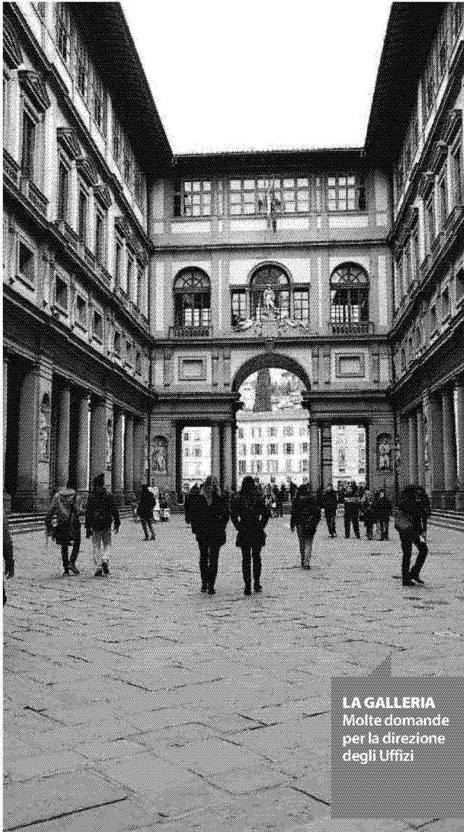
LA GALLERIA Molte domande per la direzione degli Uffizi