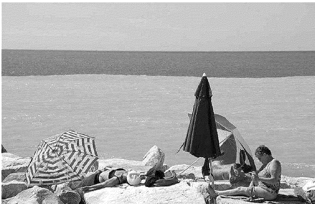
I bagnanti sugli scogli davanti al mare di due colori