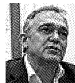
Governatore Enrico Rossi

● Attualmente è Rettrice dell'Università per Stranieri di Siena , con mandato fino al 2019