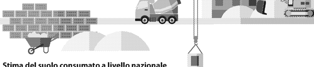
Stima del suolo consumato a livello nazionale superficie consumata pro-capite (m 2 /ab)