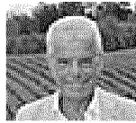
La tenuta Vittorio Giulini e la sua Tenuta La Marchesa, nella zona del Monferrato

ROMA Uno sconto sulle tasse che, però, finirebbe per dare più soldi allo Stato. Il meccanismo non è nuovo, basti pensare ai bonus per l'acquisto di mobili o infissi che hanno aiutato settori in difficoltà, portando risorse aggiuntive nelle casse pubbliche. Stavolta, però, l'idea è di applicarlo a un comparto che, almeno a prima vista, non è propriamente industriale, né popolato da persone indigenti: si tratta delle dimore storiche, e cioè quei 50 mila immobili privati fra palazzi, castelli e ville sparse su tutto il territorio nazionale. Gioielli piccoli e grandi che impreziosiscono il nostro paesaggio, vincolati dal ministero dei Beni culturali, con i proprietari obbligati per legge a tenerli in buono stato. Ma non sempre conservati al meglio. «Il patrimonio privato di beni culturali rischia di sgretolarsi e crollare come sta succedendo a quello pubblico» dice Moroello Diaz della Vittoria Pallavicini, presidente dell'Adsi, l'associazione delle dimore storiche italiane. Per evitare che questo accada, nel corso dell'assemblea dell'associazione, che si è tenuta nei giorni scorsi a Roma, è stata avanzata la proposta del bonus. Secondo uno studio di Lu-