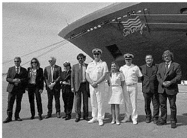
ORGOGGIO La foto di rito sulla banchina del Molo Italia