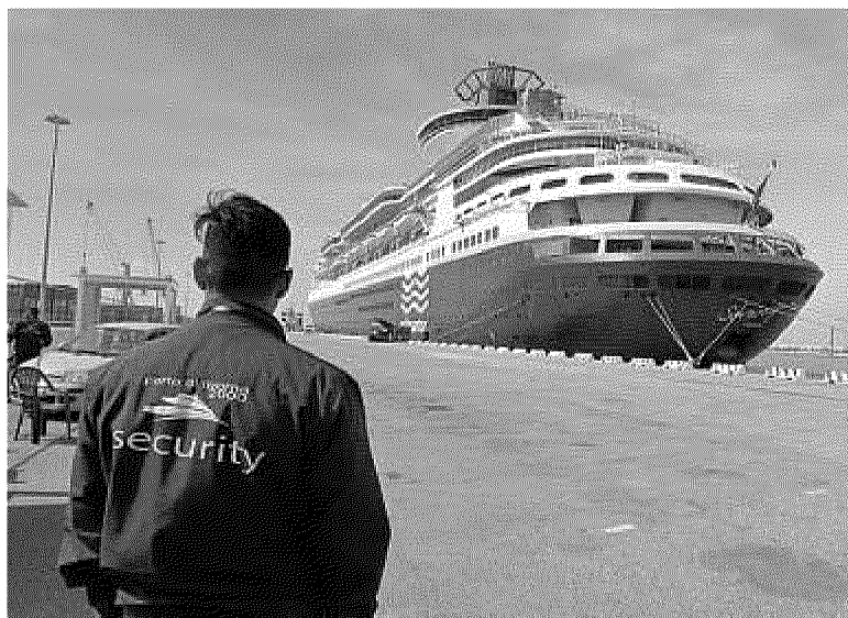
L'ARRIVO La «Sovereign» durante le fasi di approdo al Molo Italia

Ora che i suoi fondali sono stati portati a ben 13 metri di profondità, il lato nord del Molo Italia, è destinato a raddoppiare gli accosti per le navi dei prodotti forestali. Battesimo del fuoco con l'arrivo della Sovereign, 268 metri di lunghezza, 32 di larghezza, una delle ammiraglie di Pullmantur