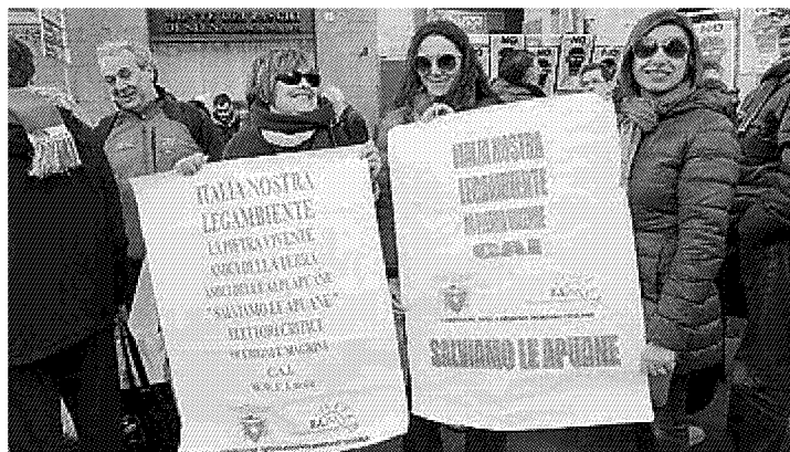
AMBIENTE Alcuni momenti del flash mob a Firenze