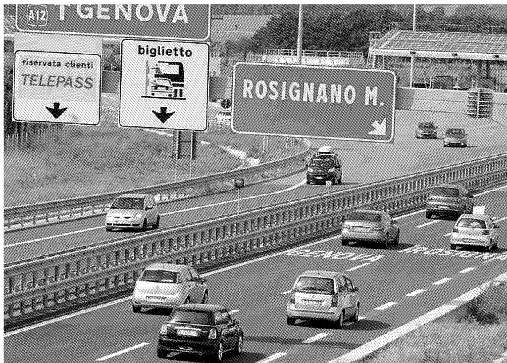
La Tirrenica a Rosignano