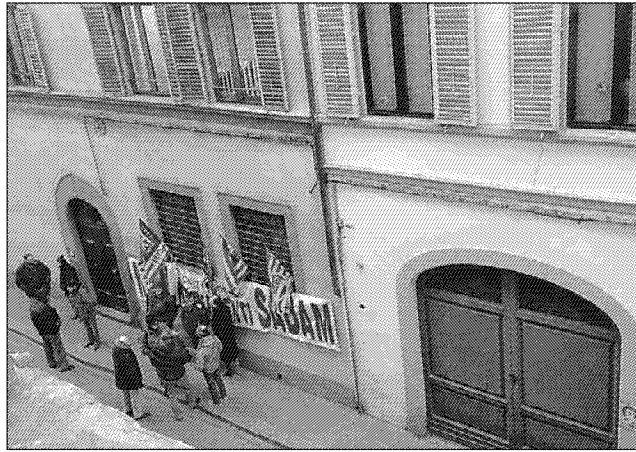
La Valdichiana è sbarcata a Firenze Ieri l'udienza al Tar per il ricorso della PowerCrop contro il parere negativo sulla centrale a biomasse a Ca' Bittoni

La discussione in udienza pubblica - erano state ammesse anche le telecamere di Rai