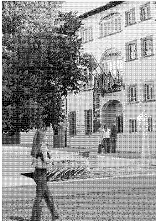
Uno scorcio di piazza Amendola col nuovo look