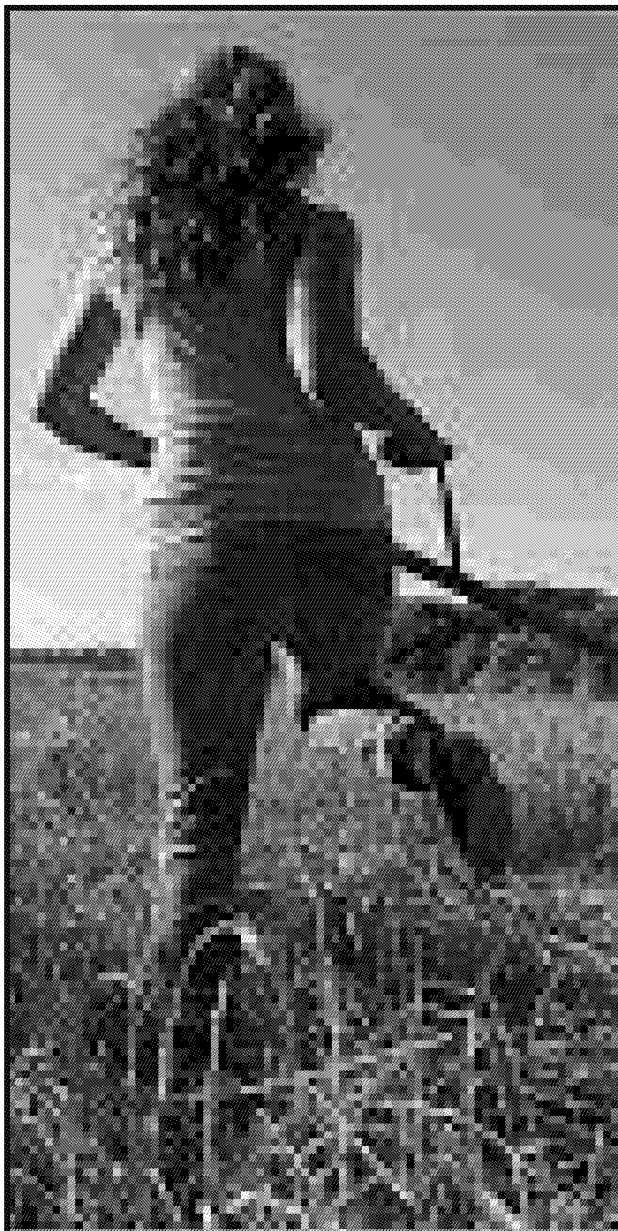
UNA SCUOLA Di agricoltura per i giovani a San Casciano (foto d'archivio)