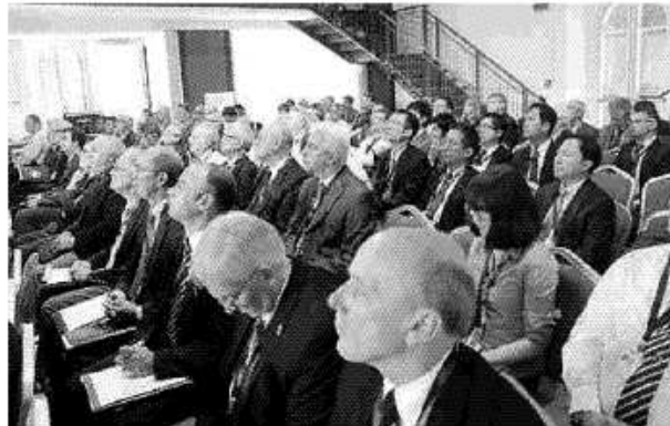
Il salone gremito per il "Panel meeting" di Sigtto