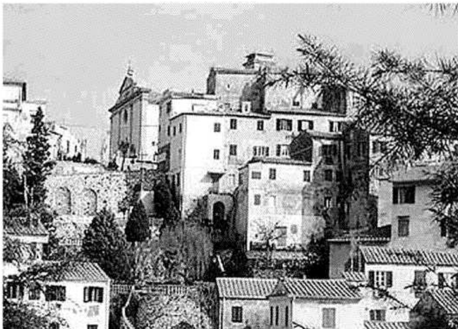
Una veduta di Rio nell'Elba

di organizzare a breve un work shop proprio per entrare nel dettaglio della legge regionale e per fornire un momento di confronto con le buone pratiche già realizzate in altre parti d'Italia.