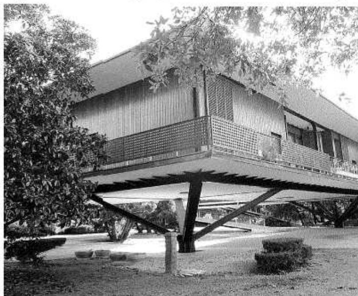
Una immagine della villa del Gombo, e sotto la copertina del libro